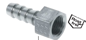
festes Gewindestück, flachdichtend