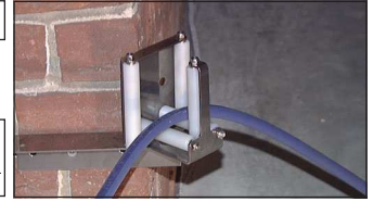
Typ SFU ES - Eck- oder Wandmontage