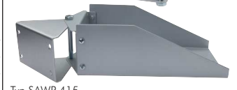
Typ SAWP 415