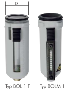
Typ BOL 1 F