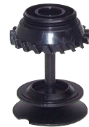
Typ FH 1