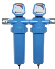
Anwendungsbeispiel: 2 Gehäuse

Lieferumfang: 2 Stk. Zuganker inkl. benötigter Dichtungen