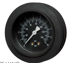
Typ HRF MANO