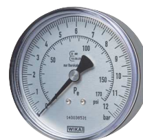
Typ HRFGS MANO