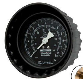
Typ HRFG MANO