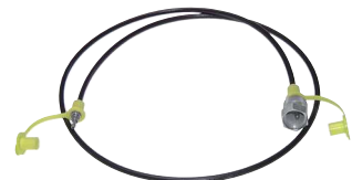
Typ ME SL ST 162/1000