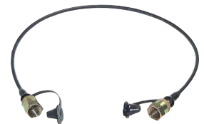
Typ ME SL 162/...