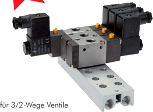
für 3/2-Wege Ventile