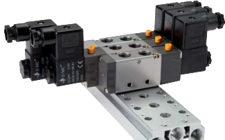
für 5/2-Wege & 5/3-Wege Ventile