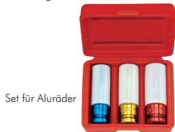
Set für Aluräder