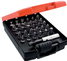
Typ Standard Bittsortiment