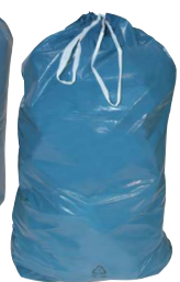
Typ MULL 120 BL