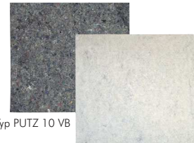
Typ PUTZ 10 VB