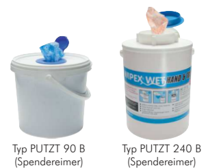
Typ PUTZT 90 B (Spendereimer)