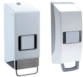
Typ SPENVARIO 2 Typ SPENVARIO 2 K