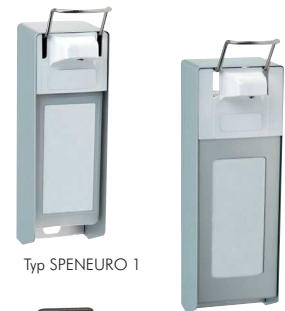
Typ SPENEURO 1