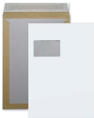
Versandtaschen mit Papprückwand