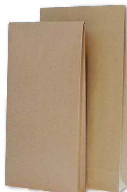
Versandtaschen mit Stehboden